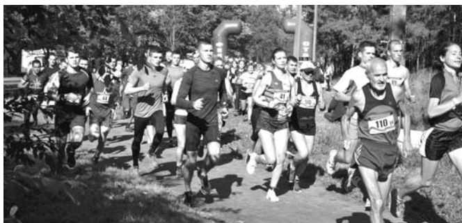
Около 2000 участников выступили в парке «Александрин» в XXXVIII пробеге памяти по юго-западному рубежу обороны Ленинграда, посвящённом героическим защитникам города. Самую массовую команду выставил СК «Кировец».

- дать возможность спортивным клубам и производственным коллективам физкультуры самим решать воп-