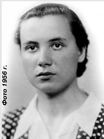
Фото 1956 г.