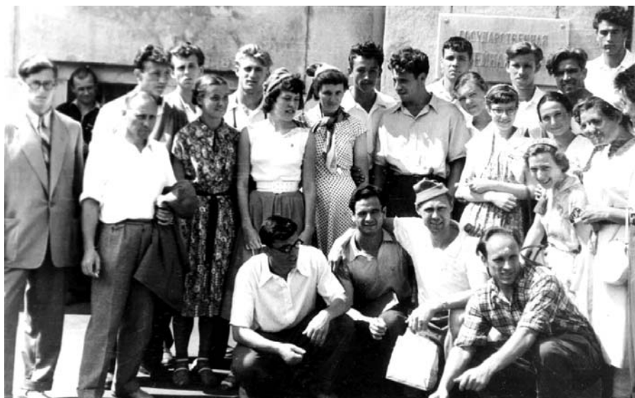
1957 г. – студенты-лесгафтовцы – на VI Всемирном фестивале молодёжи и студентов в Москве. Снимок на память вместе с участниками из других делегаций.