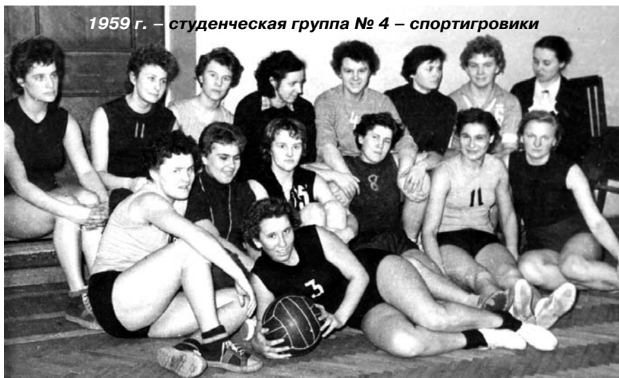
1959 г. – студенческая группа № 4 – спортигровики

– Да, на момент окончания института нас было 144 выпускника. Из этого числа 15 человек во время Великой Отечественной войны пережили блокаду Ленинграда. На нашем курсе во вре-