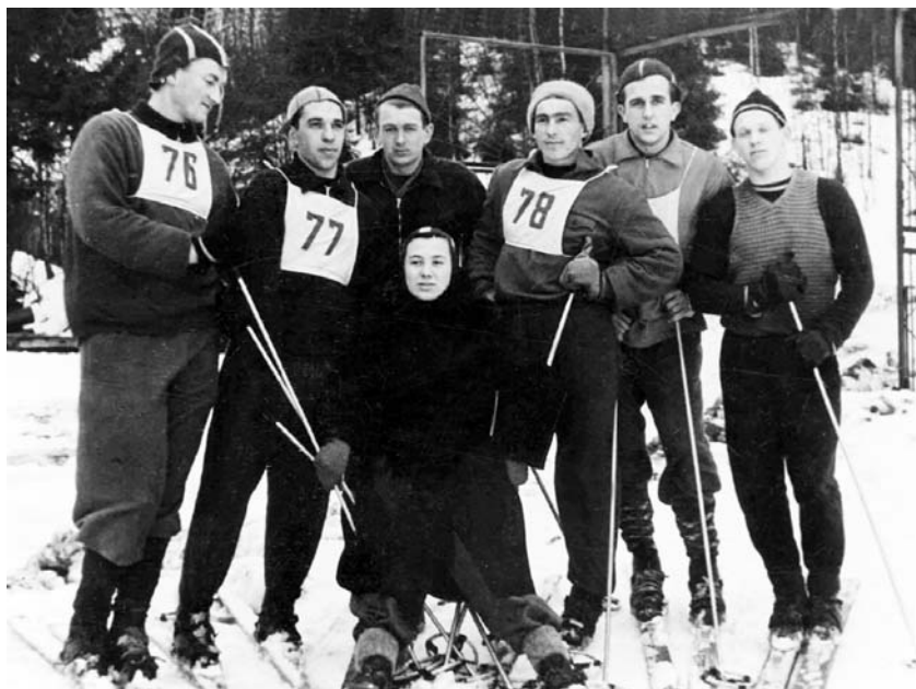
1957 г. – лыжные сборы студентов второго курса в Кавголово