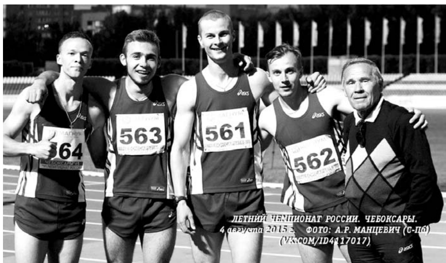
ЛЕТНИЙ ЧЕМПИОНАТ РОССИИ. ЧЕБОКСАРЫ. 4 августа 2015 г.